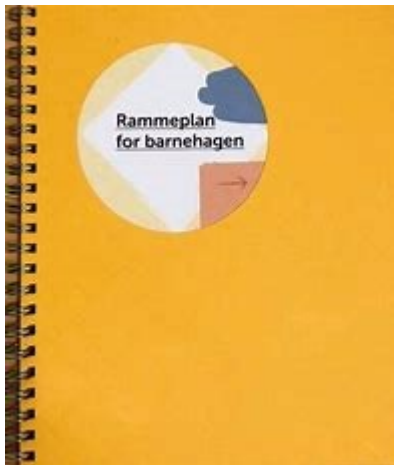
Rammeplan for barnehagen 2017:

Rammeplan for barnehagen 2017: https://lovdata.no/dokument/LTI/forskrift/2017-04-24-487 Barnehageloven