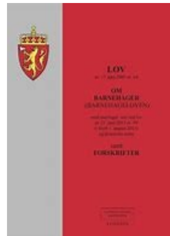
Lov om barnehager:

https://lovdata.no/dokument/LTI/forskrift/2017-04-24-487