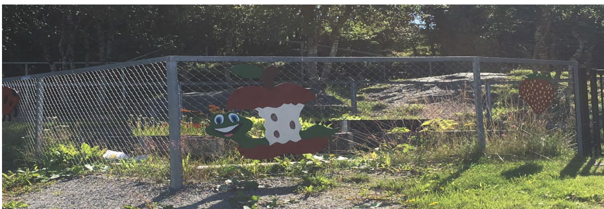
I Kjøkkenhagen dyrker vi ulike grønnsaker.