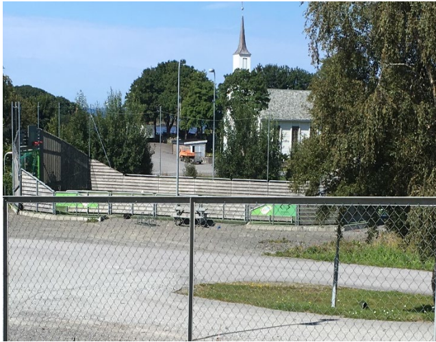
Fra sandkassa kan barna se ned på ballbingen