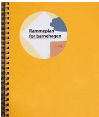
Rammeplan for barnehagen 2017:

Rammeplan for barnehagen 2017: https://lovdata.no/dokument/LTI/forskrift/2017-04-24-487 Barnehageloven