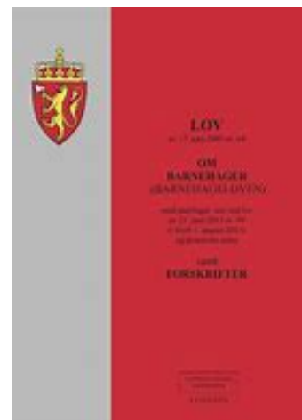
Lov om barnehager:

https://lovdata.no/dokument/LTI/forskrift/2017-04-24-487