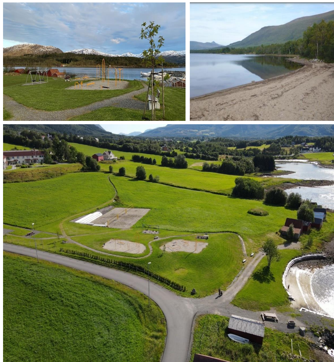
Bilde øverst fra høyre, fotograf så navnebeskrivelse - 1 og 3. Merete Rødal, bilde av Tømmerneset bade plass ved Elnesvågen Båthavn, med aktivitetspark og volleyballbaner. 2. Tove Herskedal, Tømmerbukta på Eide.

C – Registret friluftsområde. En generell lav skåre, eller minst 2 på en av de første 7 kriteriene.