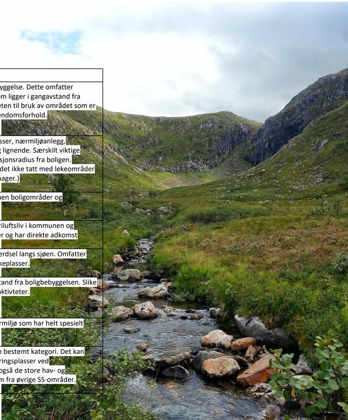
Bilde, fotograf Øystein Moen Skotheim av Surndalen