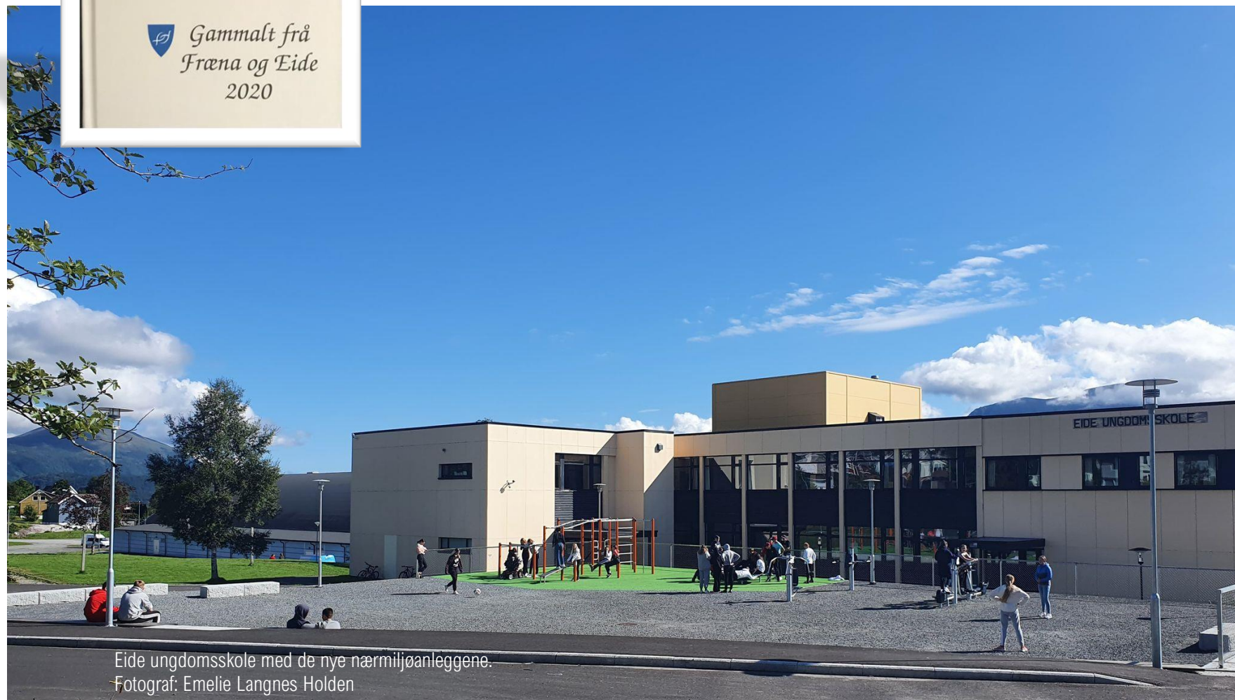
Eide ungdomsskole med de nye nærmiljøanleggene.

I år blir det også presentert lokalhistoriske utgivelser, som kan bli et fast innslag. Kanskje dette kan være årets julegave? Pris kr. 300,-