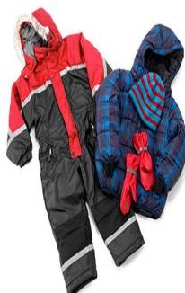
vinterdress og tynndress