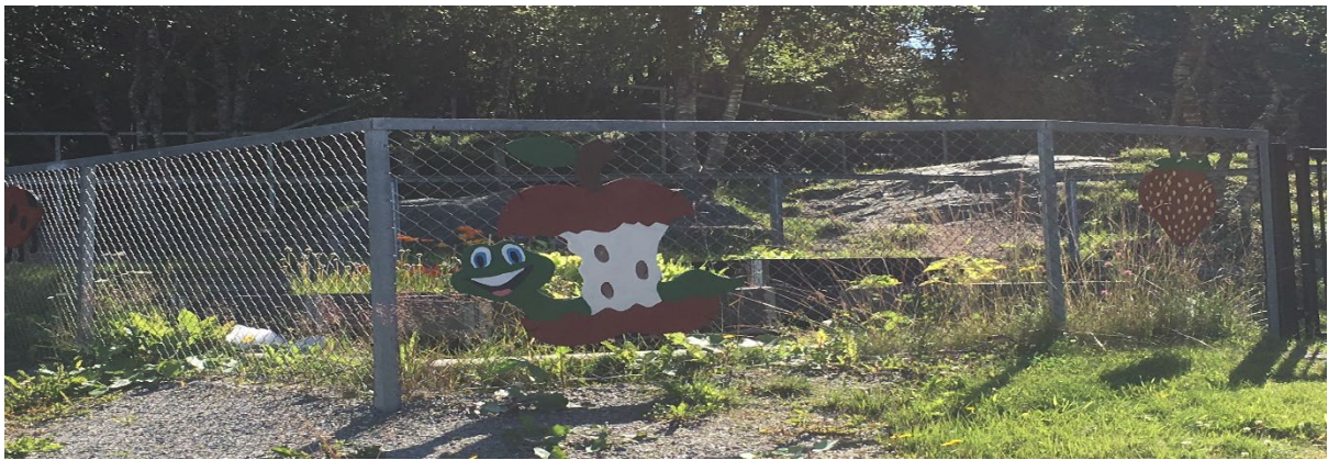
I Kjøkkenhagen dyrker vi ulike grønnsaker.