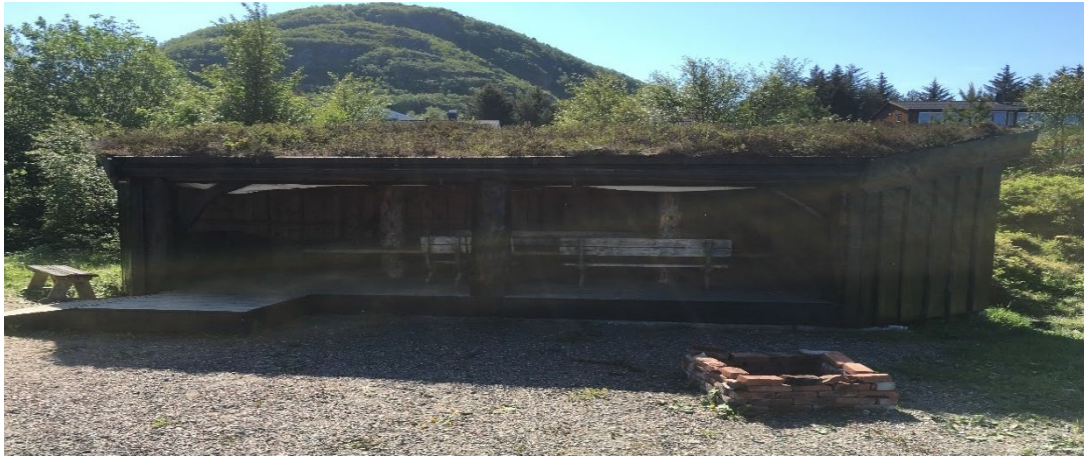
Gapahuken er en av våre faste turplasser.