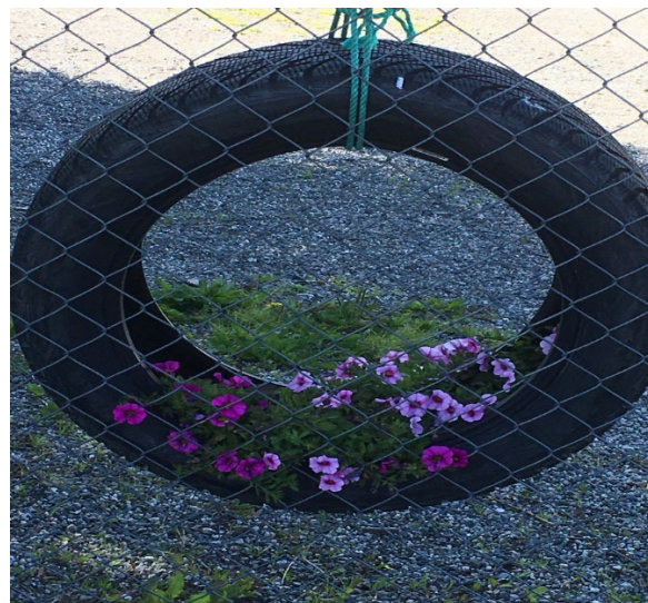
Velkommen skal du være!