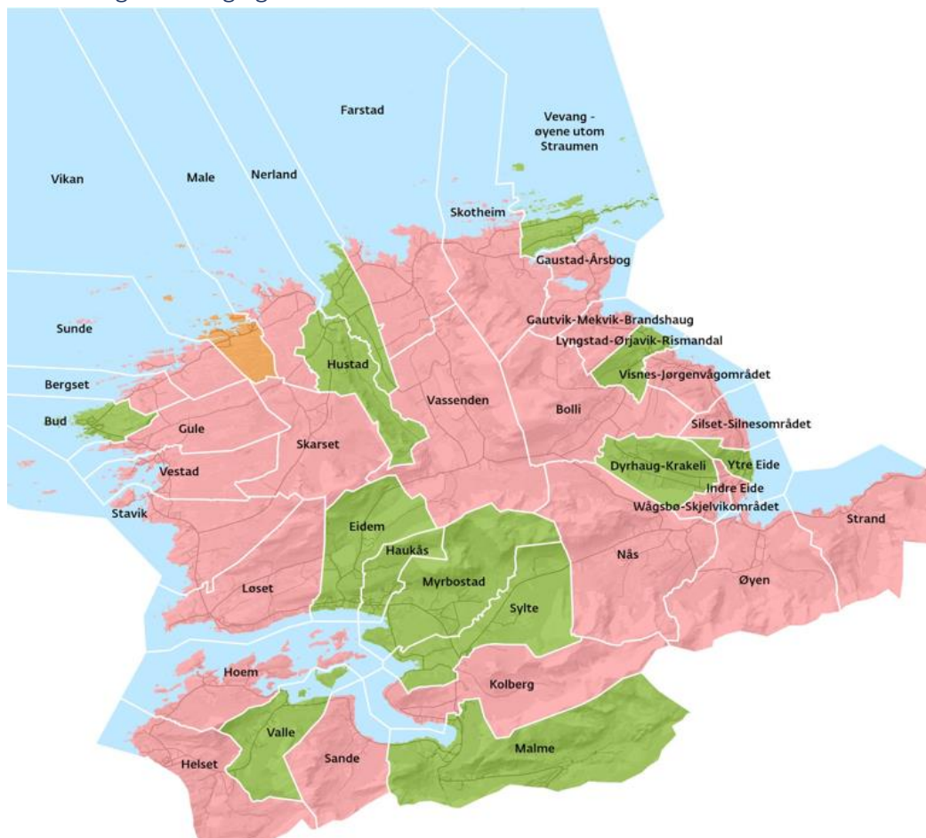
Kart 1: Utarbeidet av Møre og Romsdal fylkeskommune, der rosa farge markerer kretser med nedgang, grønt med vekst og gult med ingen endring i befolkningen fra 2015 til 2020

Befolkningsutvikling i grendene i Hustadvika kommune fra 2015 til 2020