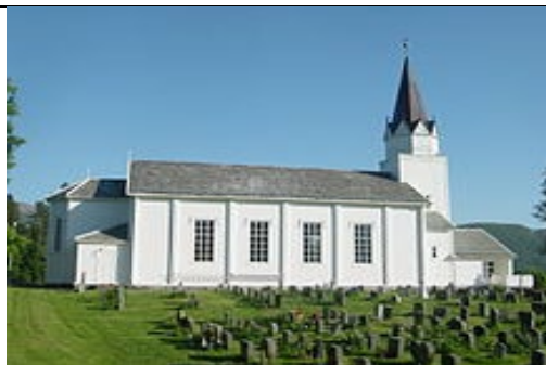
I adventstiden undrer og gleder vi oss sammen med barna. Vi formidler det kristne julebudskapet og synger ulike julesanger. Den 15. desember blir det samling for 3 – 5 åringene i Vågøy kirke.