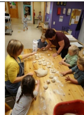
Vi baker kakemenn og pynter pepperkakehjerter til adventskalenderen.