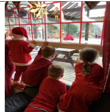
Nissefest den 19. desember med julegrøt og julepregang, og kanskje kommer nissen.....