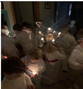
Luciafeiring 13. desember. En jente fra Gullklubb trekkes ut som Lucia. Hele barnehagen går i tog til eldreboligene. (Med forbehold)