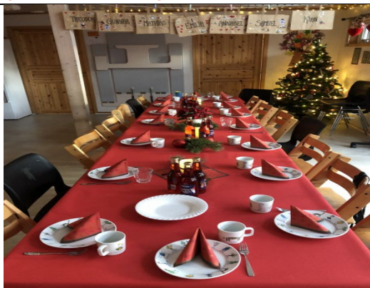
Julebord 8. desember