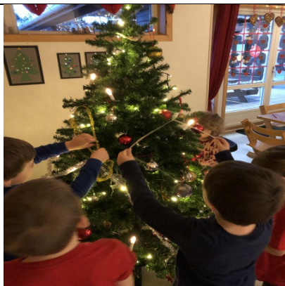
Gullklubb pynter juletreet